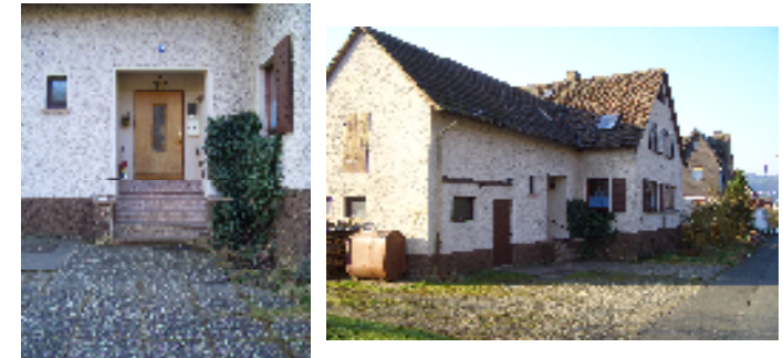
Eingangs - Ist - Situation

Genauere Beschreibungen und Baupläne für die einzelnen Position finden Sie im Anhang der Analyse.