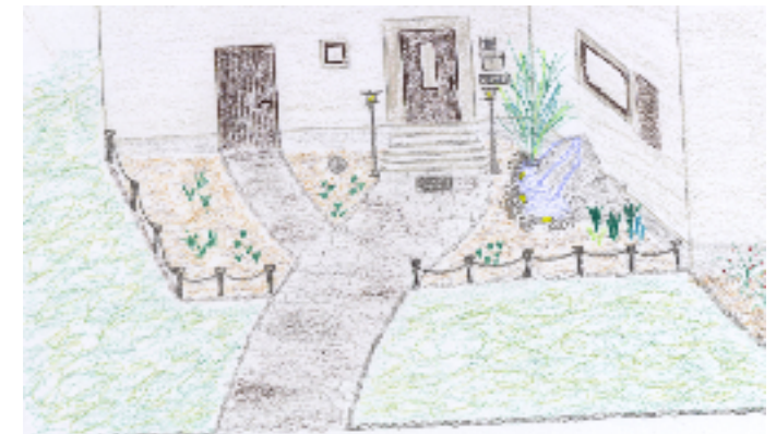
Vorschlag Gestaltung Eingangsbereich